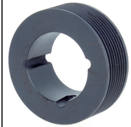
POULIES PL à moyeu amovible PPL MA x D x nb gorges G